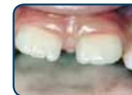
Tanden van het blijvend gebit hebben een kartelrand